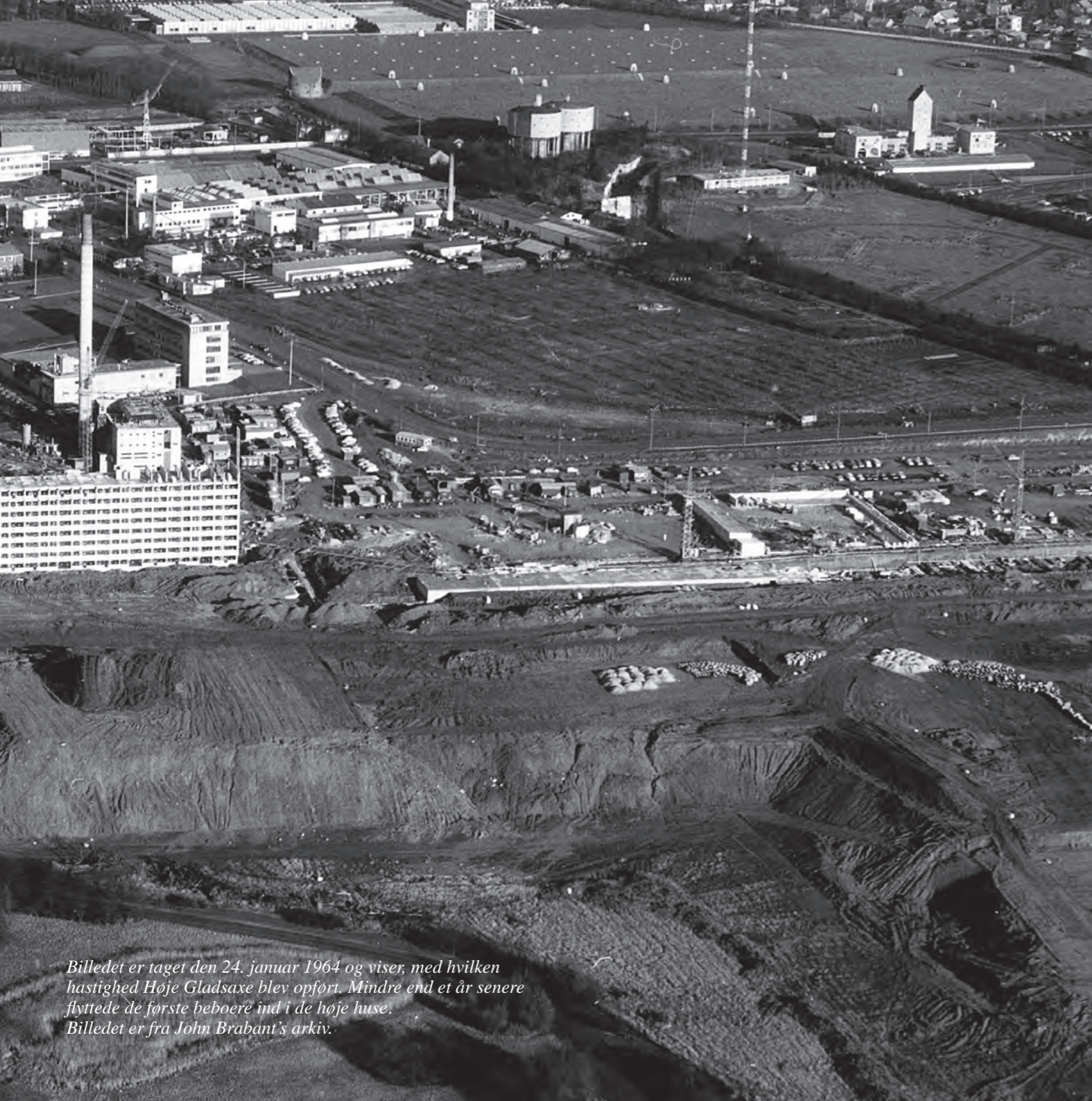
Billedet er taget den 24. januar 1964 og viser, med hvilken hastighed Høje Gladsaxe blev opført. Mindre end et år senere flyttede de første beboere ind i de høje huse.