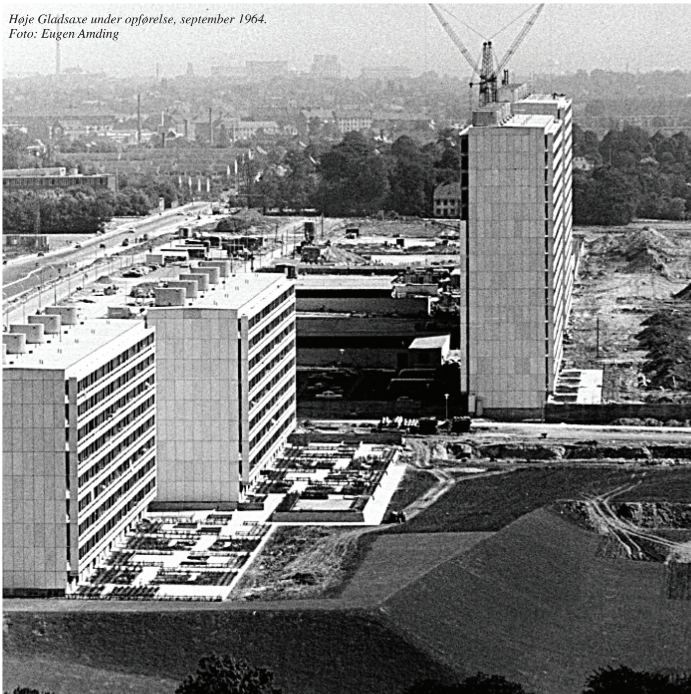
Høje Gladsaxe under opførelse, september 1964.