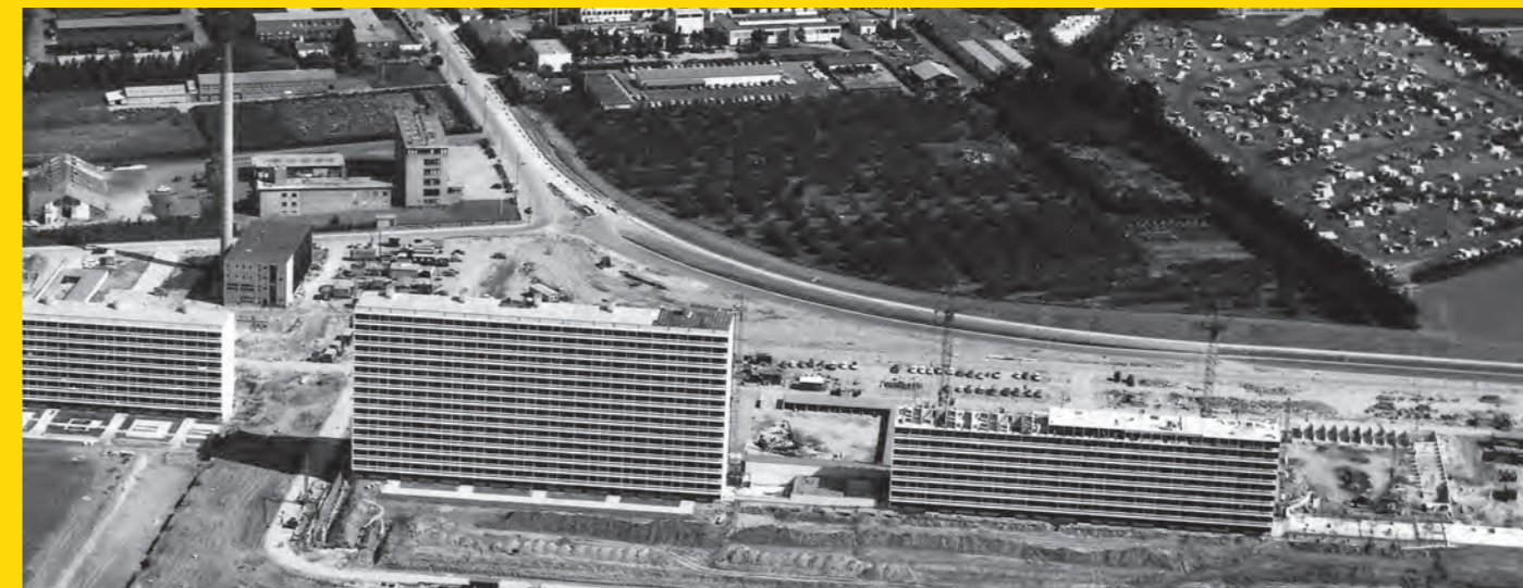
Billedet er fra John Mangelavne's arkiv og er taget den 26. juni 1964. Til højre ses den nu lukkede Høje Gladsaxe Campingplads. Den var særligt populær blandt beboerne i de små lejligheder, hvis gæster kunne overnatte i telt på campingpladsen.