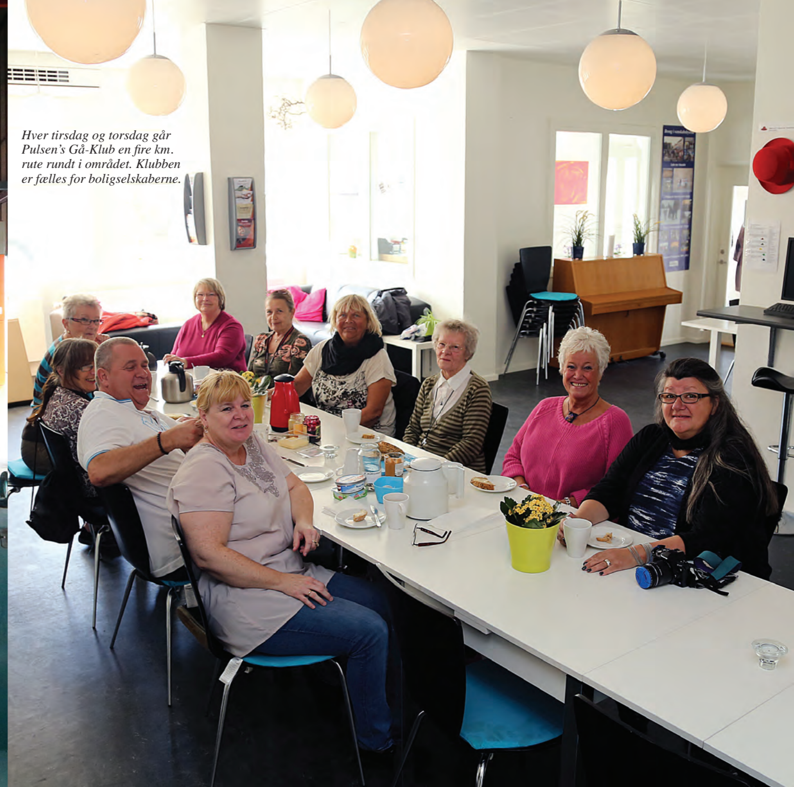
Hver tirsdag og torsdag går Pulsens Gå-Klub en fire km. rute rundt i området. Klubben er fælles for boligselskaberne.