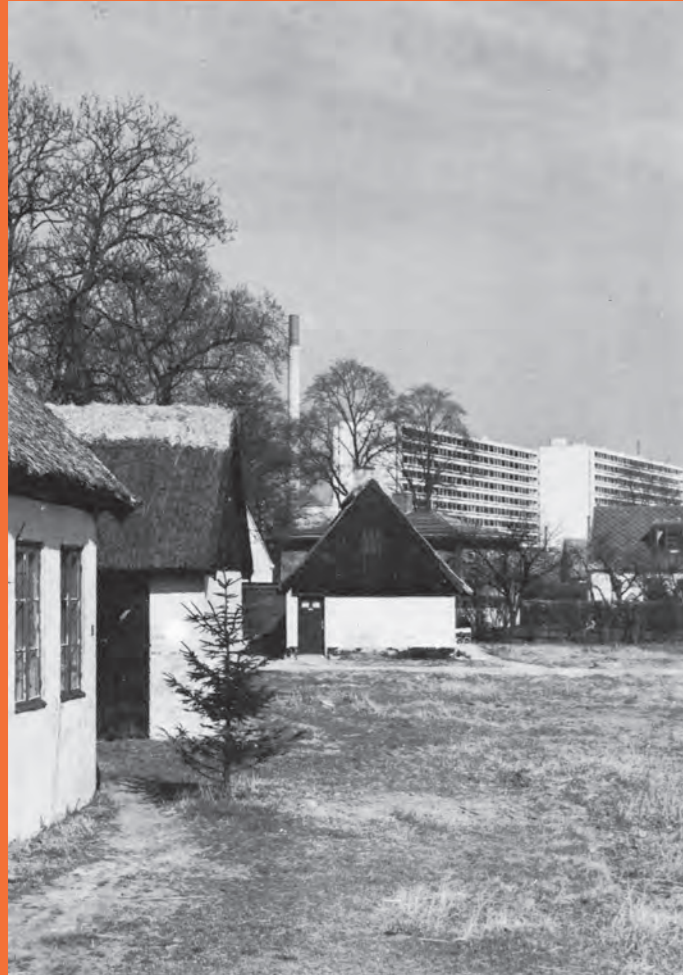
Forside og inderside fra invitationen til rejsegildet for Høje Gladsaxe og den efterfølgende middag på Lorry.