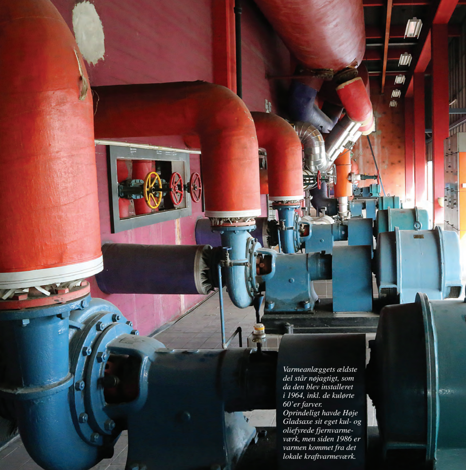
Varmeanlæggets ældste del står nøjagtigt, som da den blev installeret i 1964, inkl. de kulørte 60'er farver. Oprindeligt havde Høje Gladsaxe sit eget kul- og oliefyrede fjernvarmeverk, men siden 1986 er varmen kommet fra det lokale kraftvarmeverk.