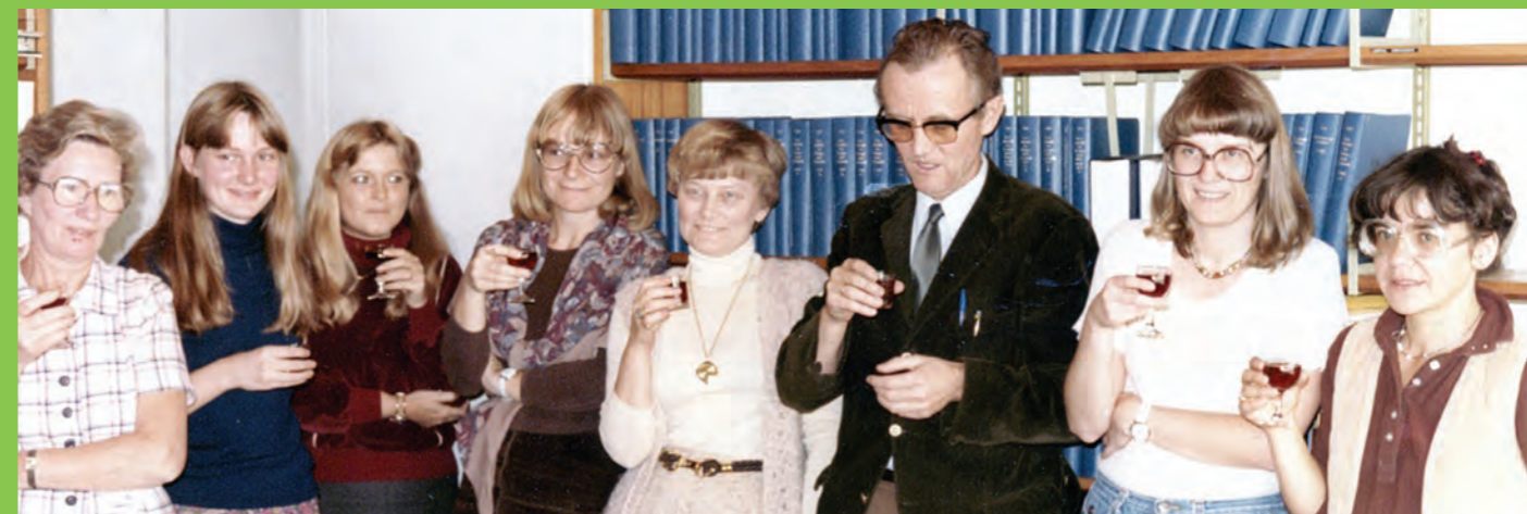
Personalet samles til en afskedsdrink den dag i 1979, da hovedbiblioteket lukkede i Høje Gladsaxe.

Høje Gladsaxe Bibliotek er kommet for at blive.